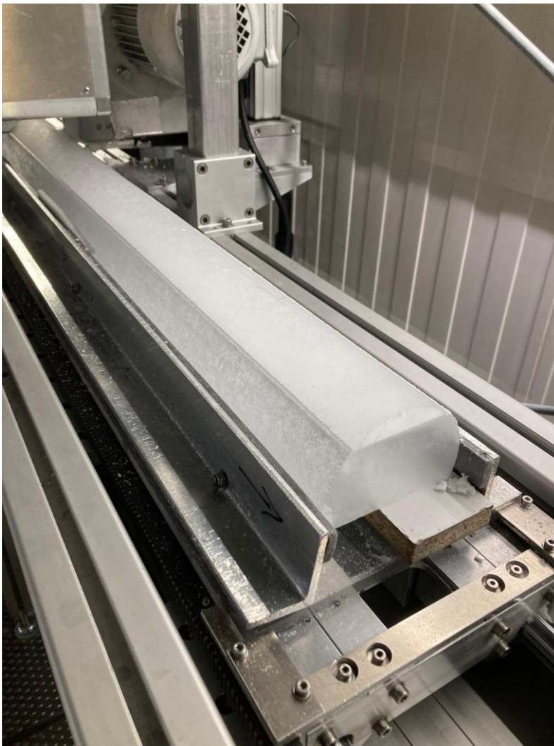
Extraction de la carotte de glace, décembre 2024.

Les scientifiques espèrent également pouvoir extraire des roches présentes sous la glace, dont les analyses pourraient indiquer quand le continent a été déglacé pour la dernière fois. Ce projet pharaonique prendra fin en mai 2026.