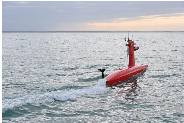
Le DriX est passé deux fois dans la zone située entre Royan et Noirmoutier en suivant un parcours en zigzag, pour cartographier le plus finement possible les dauphins, leurs proies, et leur environnement.

Du 5 janvier au 26 mars, des survols aériens se sont déroulés sur la zone centrale du golfe de Gascogne pour compter les mammifères marins de la côte jusqu’au talus continental. Réalisées suivant un protocole standard par deux observateurs à bord, les observations d’espèces sont saisies en temps réel par un navigateur. Sur 8 900 km, plus de 3 000 mammifères marins de 8 espèces différentes ont été détectés, dont 2 500 petits delphinidés, en grande partie des dauphins communs. 25 carcasses de delphinidés ont également été comptabilisées à la surface.