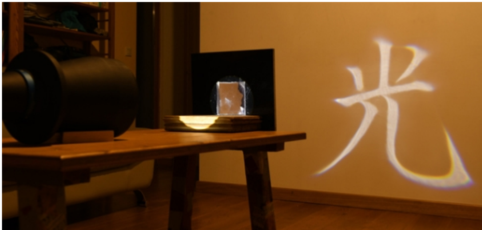
Figure 2 : Prototype physique. La lumière parallèle uniforme (comme les rayons du soleil) se projette sur un mur après réfraction à travers la lentille. La lentille a été conçue de telle manière que ce que l'image projetée forme le caractère japonais Hikari.