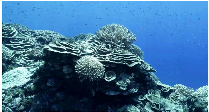
Récifs coralliens dans les Tuamotu

Images, rush vidéos et infographies libres de droits disponibles sur demande.