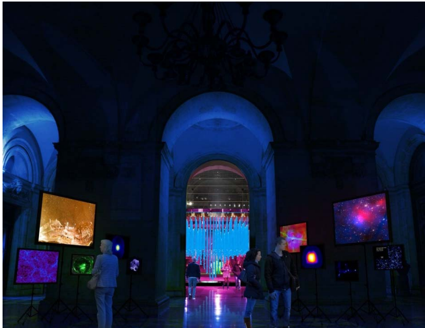
Modélisation d'une partie de l'atrium de l'Hôtel de ville de Lyon.

© CNRS, modélisation Alban Perret Studio