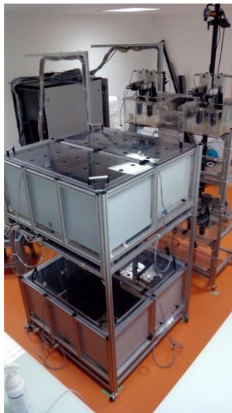
Souris City : système de vie en collectivité, composé de deux cages de 1 m 2 au sol, où les animaux ont accès à une zone de test automatique dans un labyrinthe en T.

1 Ces laboratoires sont membres de l'Institut de biologie Paris-Seine