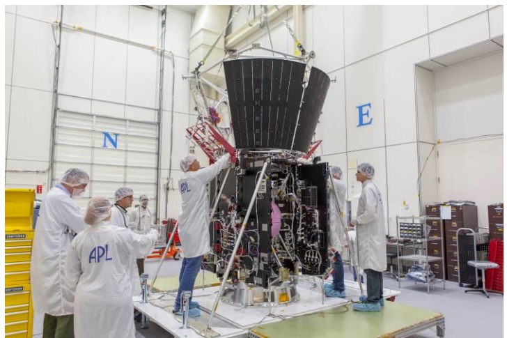
Assemblage de la sonde américaine Parker Solar Probe.