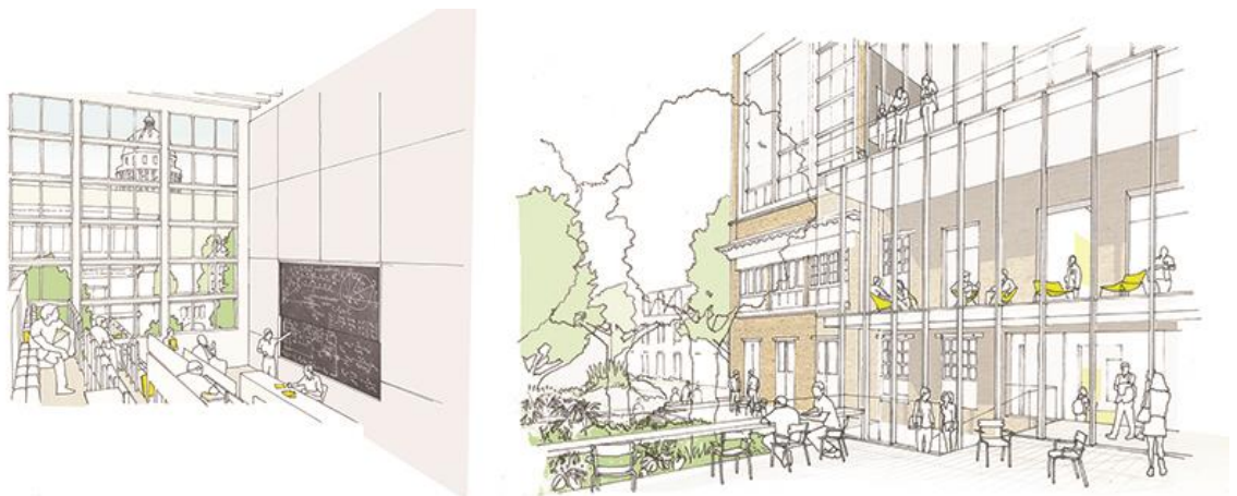
Amphithéâtre (à gauche) et jardin (à droite)

Pour en savoir plus : le chapitre 2 sur la Maison des mathématiques est disponible sur You Tube