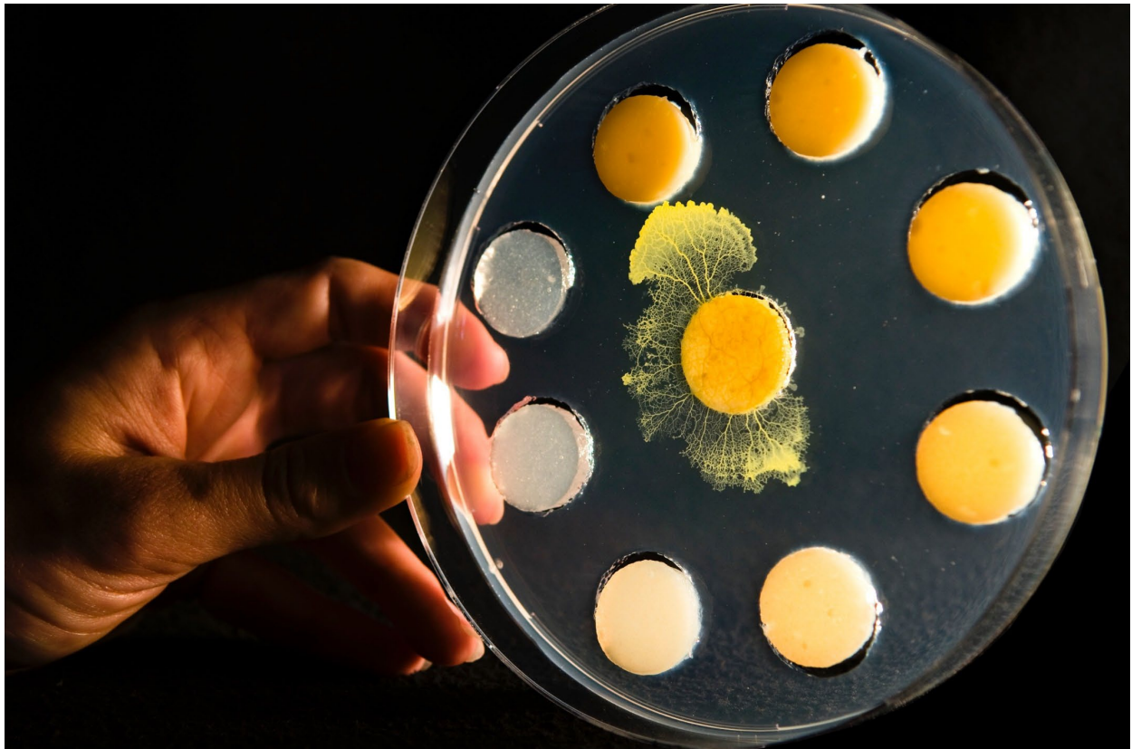
Développement du myxomycète Physarum polycephalum