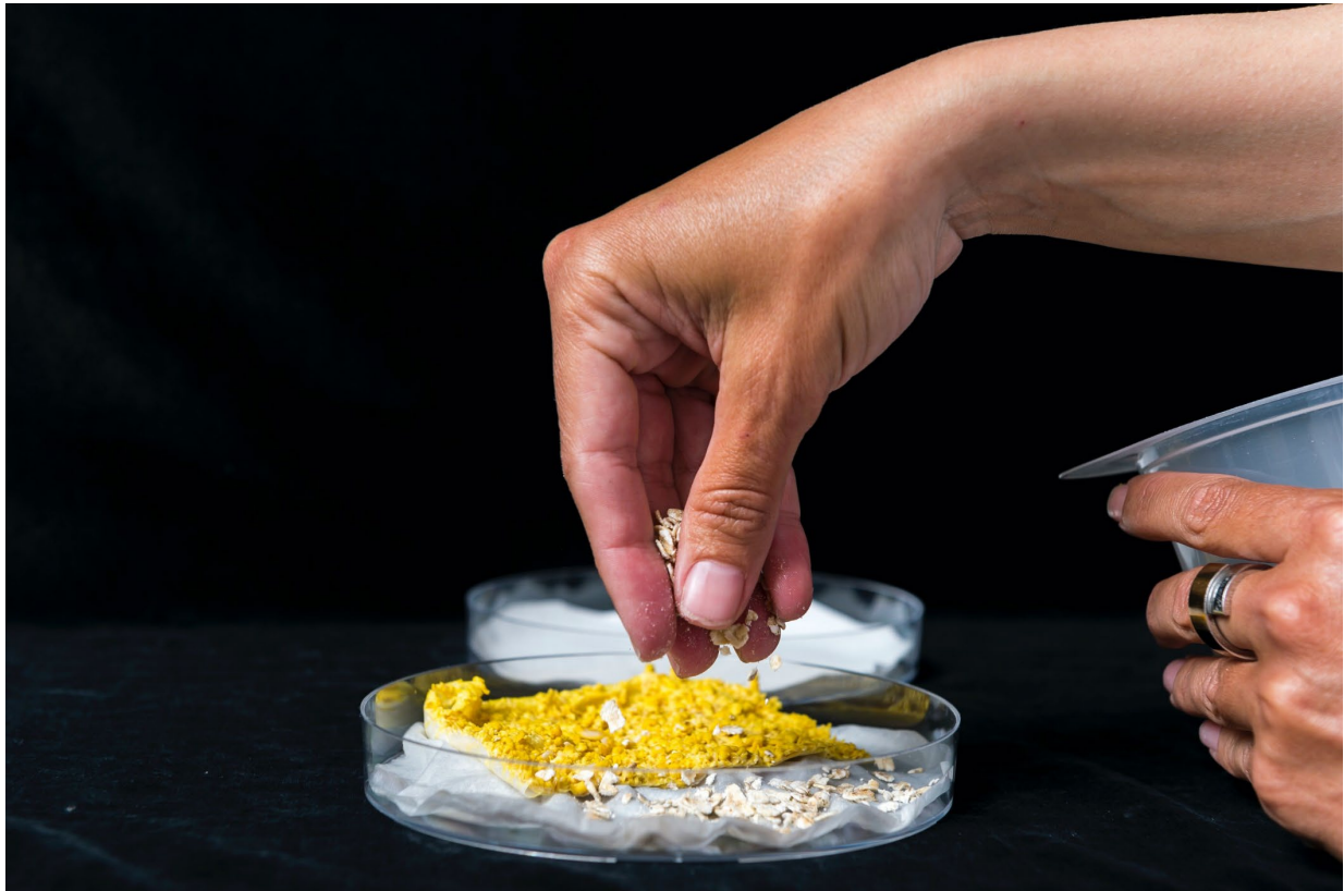
Nourrissage du myxomycète Physarum polycephalum dans une boîte de pétri