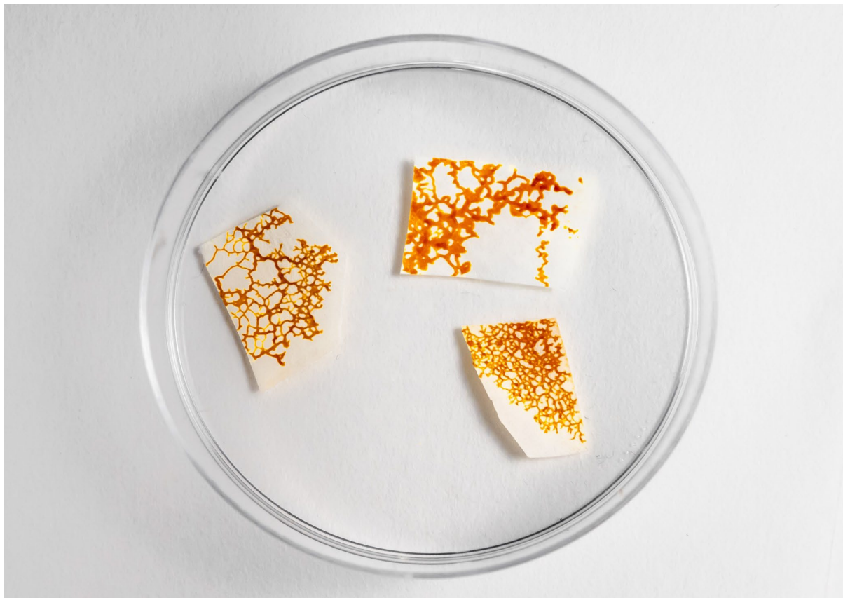
Développement du myxomycète Physarum polycephalum

Quand les conditions se dégradent (le milieu devient sec et la nourriture vient à manquer), le blob entre en dormance. Il se réveillera lorsque les conditions s'amélioreront.